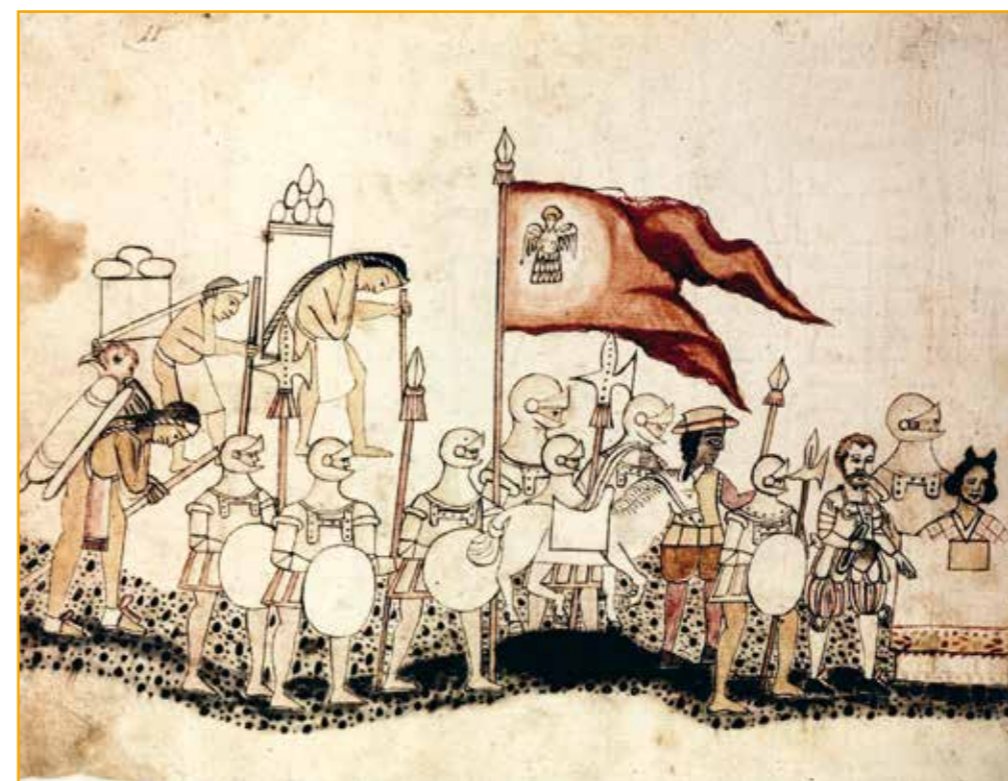
Llegada de Cortés a México, con La Malinche.

Procedente de una familia de hidalgos de Extremadura. Sale en 1504 hacia Santo Domingo como escribano. En 1519 comienza su expedición al continente americano pasando por la península de Yucatán (México). La Malintzin (la Malinche), una princesa indígena ofrecida a Cortés por unos indios a los que había vencido, tuvo un papel muy importante en la conquista de Cortés. Le sirvió de intérprete y le ayudó a comprender las rivalidades que existían entre los diferentes grupos amerindios. Cortés fue un hábil estratega que consiguió con unos 100 hombres conquistar la capital del imperio azteca, Tenochtitlan. Después de la conquista de México, Cortés realizó otras expediciones en el territorio de la actual California. Fue quien introdujo el cacao (bebida sagrada azteca) en Europa.