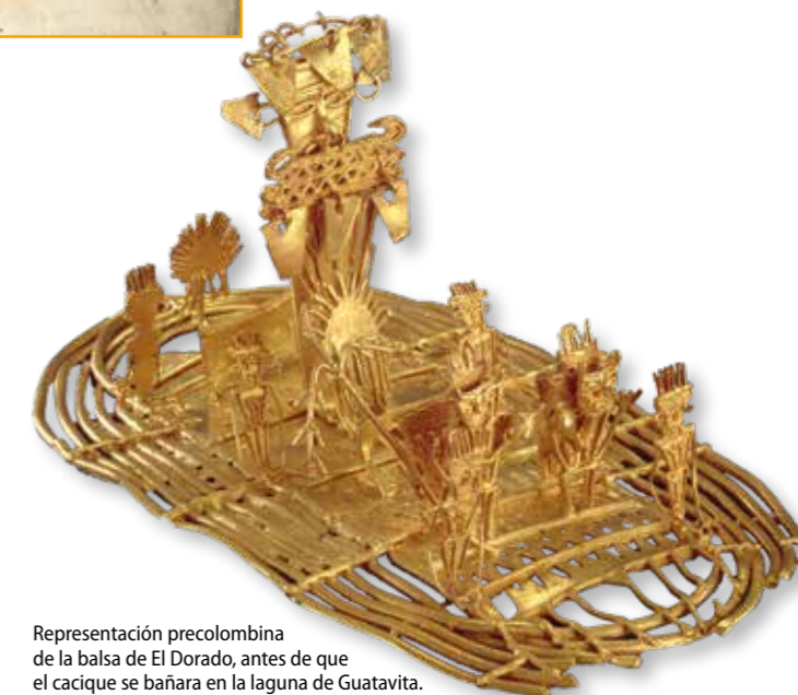
Representación precolombina de la balsa de El Dorado, antes de que el cacique se bañara en la laguna de Guatavita. Pieza de orfebrería realizada por artesanos muisca, conservada en el Museo del Oro (Bogotá, Colombia).

El mito alimentó una fiebre del oro que perduró a lo largo de los siglos y se apoderó de conquistadores de todas las épocas y nacionalidades.